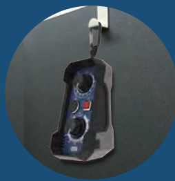
ストラップホール Straphall