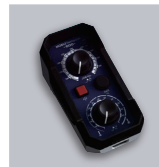
モバイルリモコン

溶接機用リモコンにより、溶接中でもアークの確認と溶接条件の調整が可能です。アークから目を離すことなく条件変更できるため、アークの細やかな変化を確認でき条件設定にかかる時間を削減します。