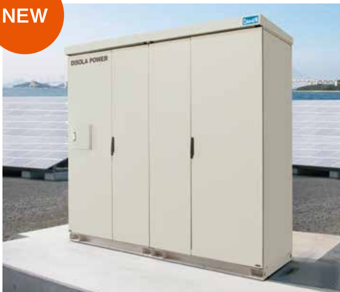
P500JHL2-A01 / P500JHL2-B01 / P500JL2-B01