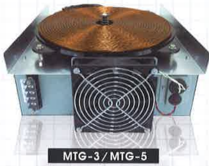
MTG-3 / MTG-5