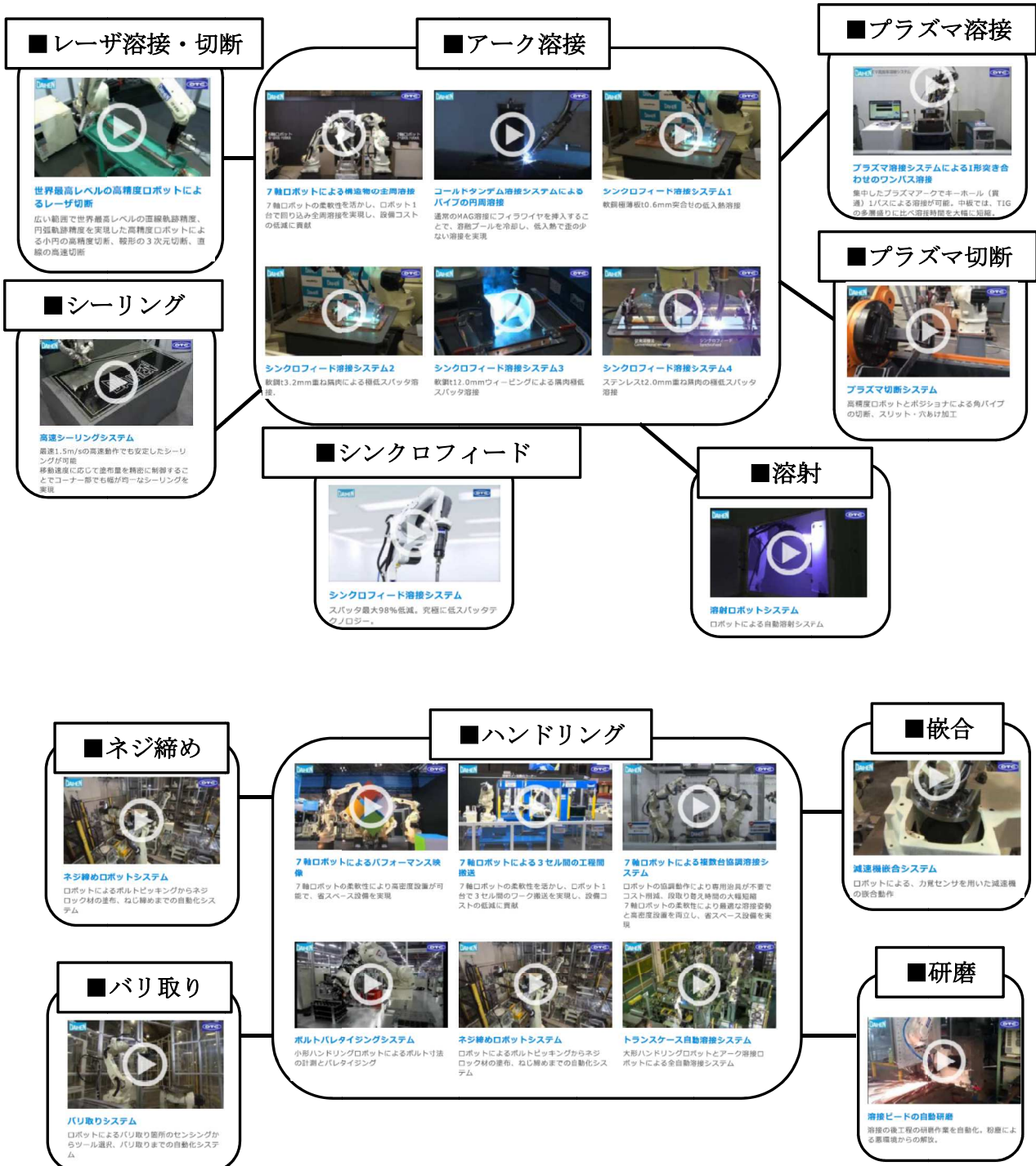
図6 本ロボットサイトの動画ライブラリー