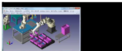
図3 ハンドリング用途の関連製品・機能