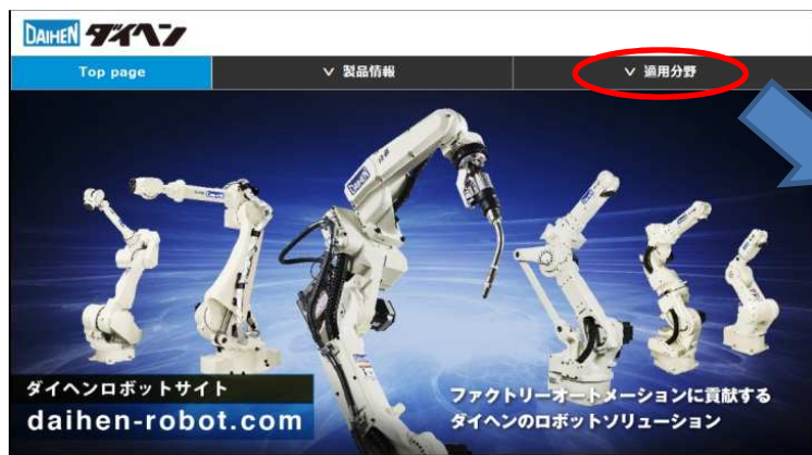
図1 ダイヘンロボットサイト トップメニュー