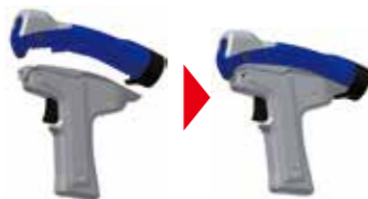
ガンタイプハンドルを装着