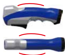
手にフィットする握りやすいハンドル形状

人間工学に基づいた握りやすいハンドル、溶接時の動きのデジタル解析による最適なトーチ形状で、楽々溶接。