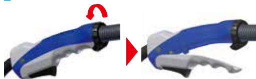
工具レスで分割可能

ガンタイプやロングトリガタイプなど作業者が使いやすい形状に工具レスで簡単に変更可能。