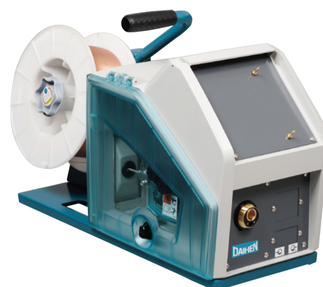
鉄仕様 Steel wire model

Good balance and easy-to-grip Excellent transportability realized thanks to the handle grip