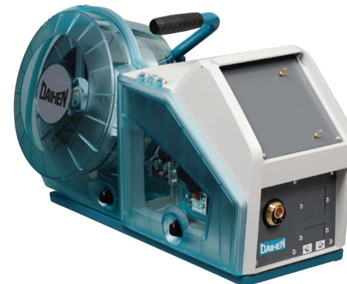
アルミ仕様 Aluminum wire model