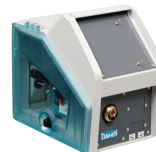
自動機仕様 Automation model